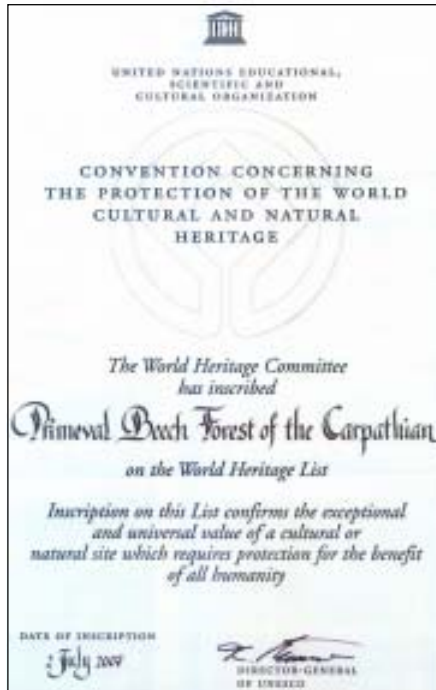
Сертифікат про занесення букових пралісів Карпат до переліку об'єктів Всесвітньої спадщини ЮНЕСКО

В цілому, узагальнюючи деякі підсумки проведеної роботи, можна сказати, що перші резервати у Карпатах та Карпатський біосферний заповідник відіграють, по-перше, важливу екостабілізуючу роль, зокрема у паводково небезпечному верхів'ї басейну Тиси, служать ядровими зонами Карпатської екологічної мережі, оберігають унікальне біорізноманіття, надають значні екосистемні послуги, зокрема постачають чисте повітря та прісну воду, для населення значної частини Європи, виступають важливим акумуляторами вуглекислого та інших газів, що викликають глобальне потепління на Землі. По-друге, забезпечують збереження найбільших у Європі природних цінностей - букових пралісів