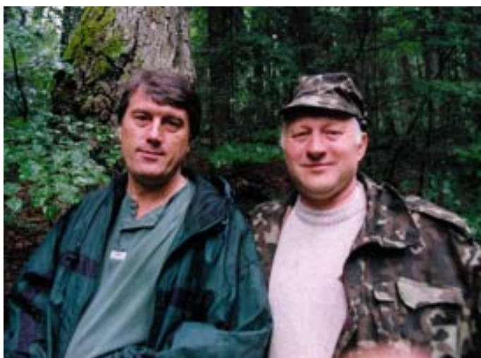
Прем'єр-міністр України В.А. Ющенко (зліва) під час знайомства з Чорногірськими пралісами (2000 р.).