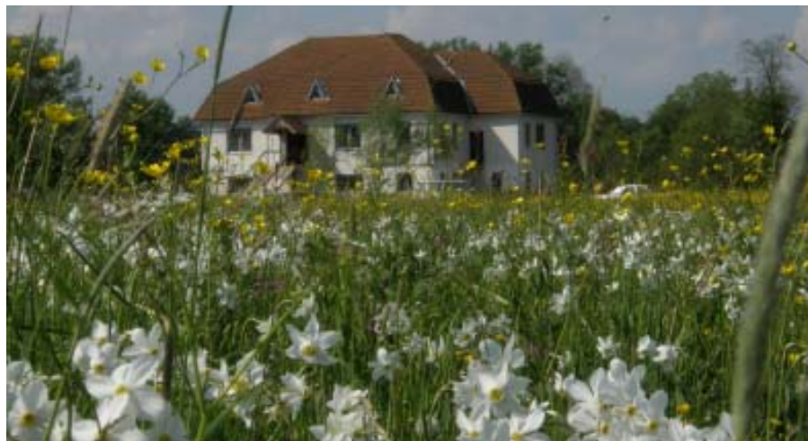
Еколого-освітній центр «Музей нарцису»