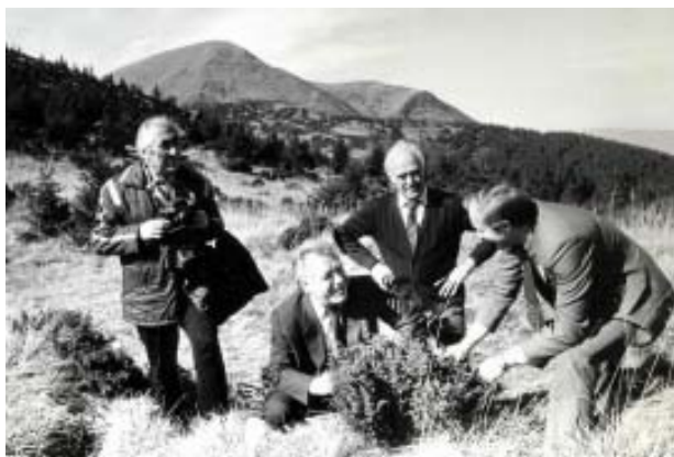
Під час екскурсії учасників конференції з нагоди 20-річчя заповідника у Чорногорі (1988 р.), зліва направо: професор С.М. Стойко, академік НАН України К.М. Ситник, М.А. Голубець та директор заповідника Ф.Д. Гамор.