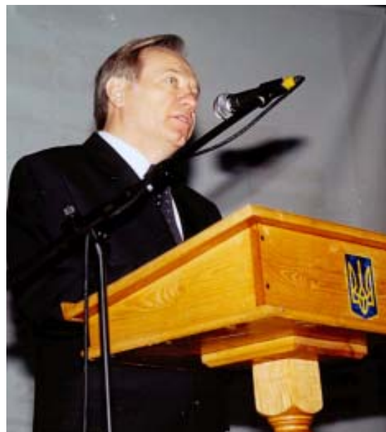
Голова державного комітету лісового господарства України М.М. Колісніченко виступає з трибуни міжнародної наукової конференції «Природні ліси помірної зони Європи: цінності та використання» (2003 р.).