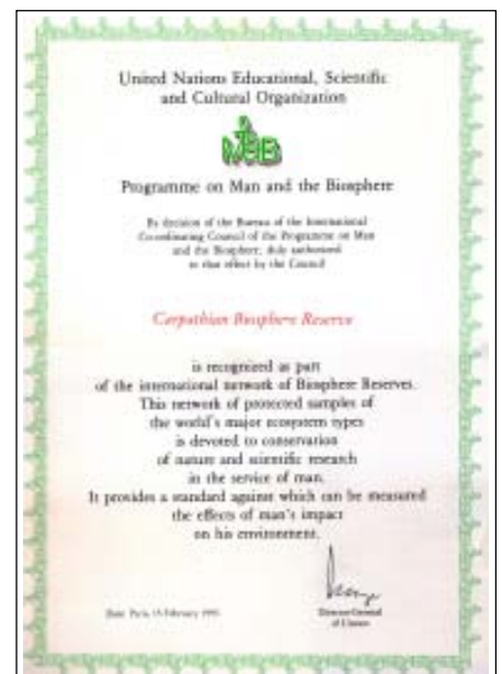
Сертифікат про включення Карпатського біосферного заповідника до міжнародної мережі біосферних резерватів ЮНЕСКО