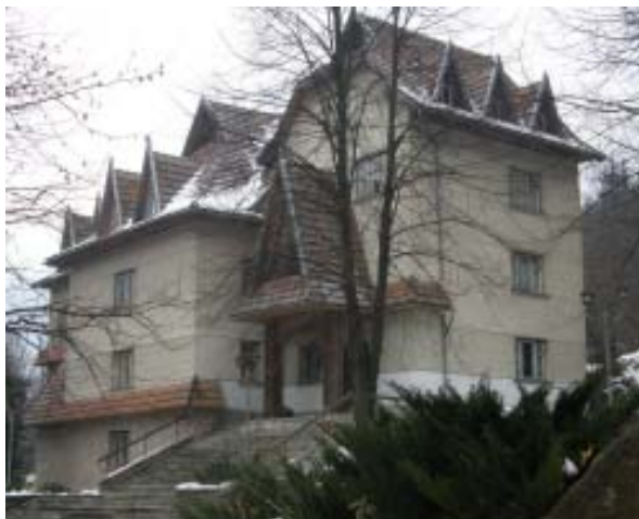
Музей екології гір та історії природокористування в Українських Карпатах

Рахів). Музей нарцису (м. Хуст), еколого-освітній центр у географічному центрі Європи, мережу інформаційних пунктів та еколого-освітніх маршрутів тощо. З 1994 року видається Всеукраїнський екологічний науково-популярний журнал "Зелені Карпати". Випускається також регіональна екологічна газета "Вісник Карпатського біосферного заповідника", працює власна відео студія, публікується велика кількість статей у центральних та місцевих засобах масової інформації, готуються спеціальні передачі на радіо і телебаченні тощо.