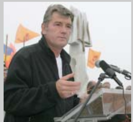
Віктор Ющенко відкриває пам'ятний знак на горі Говерла