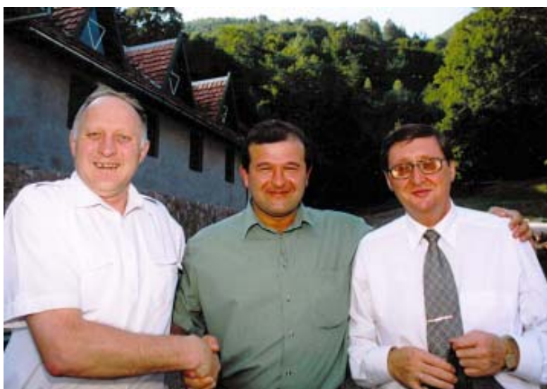
Голова Закарпатської обласної державної адміністрації В.І. Балага (в центрі) та голова центральної виборчої комісії України М.М. Рябець (справа) під час знайомства з роботою біосферного заповідника (1999 р.).