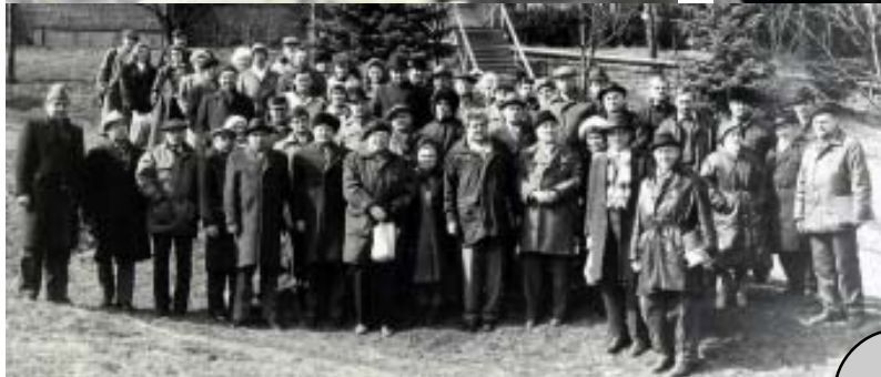
На науково-практичному семінарі в Карпатському заповіднику проходить перше обговорення Закону України «Про природно-заповідний фонд України» (1992 р.). На трибуні заступник міністра охорони навколишнього природного середовища України В.В. Костицький, та фото учасників семінару на згадку.