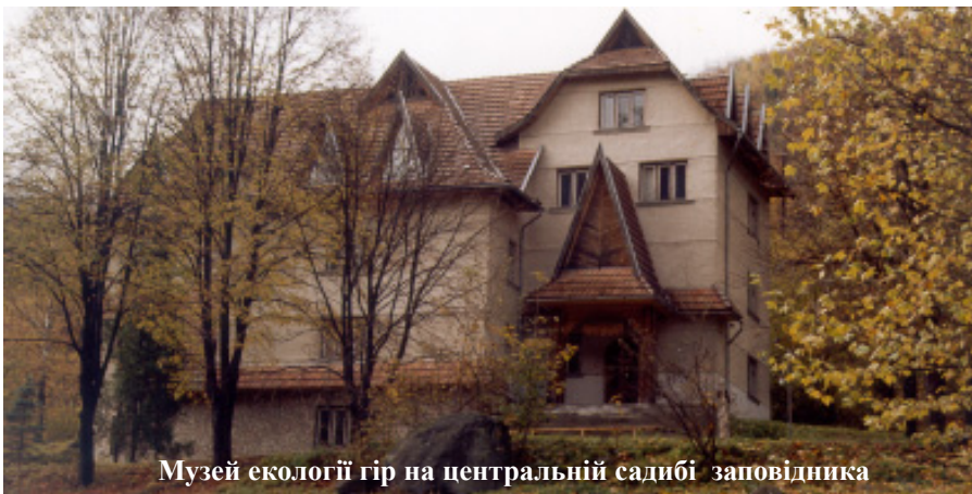
Музей екології гір на центральній садибі заповідника

18 травня, у Міжнародний день музеїв, українські музеї щиро вітають гостей.