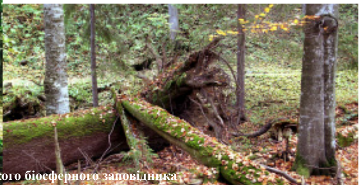
Букові праліси Карпатського біосферного заповідника